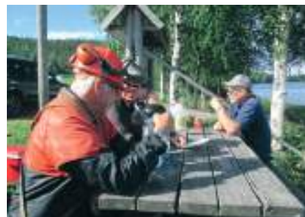
Viktigt med energipåfyllning till bys dream team

Nationalälvdagen vid vindskjulet. Det fritt strömmande vattnet i vår orörda älv firades i vanlig ordning med knytnis, eldar, marschaller, grillning och gemenskap. Trots det mindre bra vädret slöt bybor upp. Nästa år finns röster om att vi ses ute på Karsina?