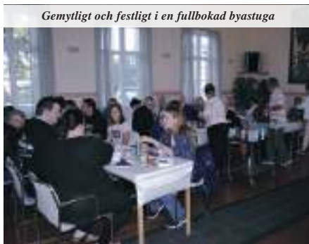
Gemytligt och festligt i en fullbokad byastuga