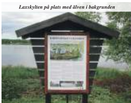
Laxskylten på plats med älven i bakgrunden