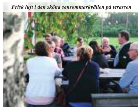
Frisk luft i den sköna sensommarkvällen på terrassen

Månsby-mössan. I samarbete med Hjälp Reklambyrå har vi tagit fram den unika "Månsby-mössan" med fyra olika motiv: "loggan", "älgen", "fisken" och "Månsbyn" i text. En storlek i svart eller grått. Mössorna finns att beskåda i byastugan och säljs för 150 kr (studiegruppen "Månsbyn Från Förr" finns där på tisdagkvällar). Du har även fått ett beställningsformulär i din postlåda och vi har gjort ett inlägg på Månsbyns Facebooksida. "Månsby-mössan" är lämplig som julklapp, skynda fynda! Vid stort intresse finns möjlighet till flera beställningar.