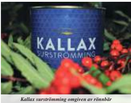
Kallax surströmming omgiven av rönnbär

Surströmmingsfest i byastugan. Den väldoftande och välsmakande firren inmundigades med god aptit. För att tillgodose alla smakinriktningar fanns som brukligt även sill och köttbullar. Surströmmingsfesten är en återkommande tradition i vår by.