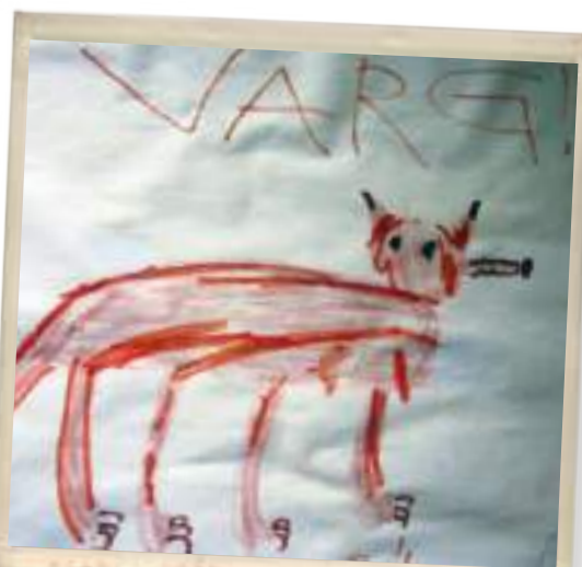
En varg i vilt tillstånd tecknad av Erik Tingvall.

Framför gärna dina synpunkter till föreningens styrelseledamöter; saker som berör Månsbyns Framtids verksamhet. Lämna även förslag på någon ny aktivitet eller ett trevligt hålligång, dock inom ramen till rådande förhållanden - ekonomi och engagemang.