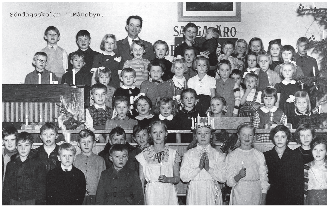
Söndagsskolan i Månsbyn.