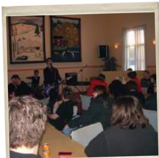
Välbesökt pubafton i Byastugan.

Pubafton med livebandet SIXXTIE 9. Den 31 mars 2012 arrangerades en välbesökt pubafton i vår Byastuga där musikerna var ungdomar från byn. Ett gäng med energi och entusiasm som tränar regelbundet. Vi ser framemot nästa hålligång med musikunderhållning i vår Byastuga. Håll utkik på våra anslags-tavlor när det är dags!