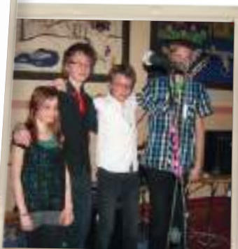
Livebandet SIXXTIE 9.