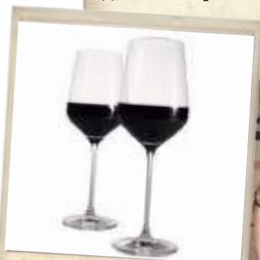
Gott i glasen.